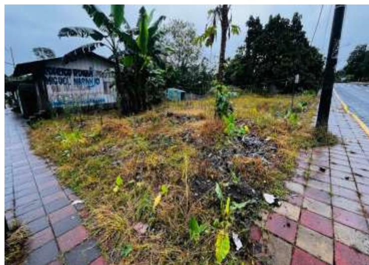
Imagen: 1- Área de terreno evaluado.